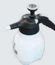
Rozprašovacia fľaša K dispozícii v stavebninách