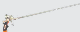
Bauder pištoľ na penu Kód výrobku: 7536 0080